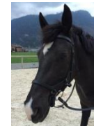
Fleur de Nuit (2009) Team Basis 1