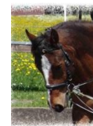
Arco de don Quichotte (2003) Team Basis 2 und Nachwuchs 2